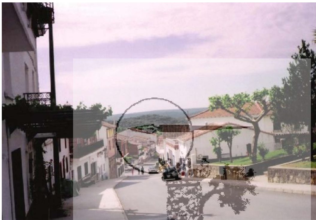
Ramacastañas. Calle de la Esperanza.

A la pregunta treinta y cuatro dijeron: No les comprende su contenido por no haber en el pueblo quien haga prevención de materiales o entre en arrendamientos o haga otro algún comercio de los que comprende la pregunta.