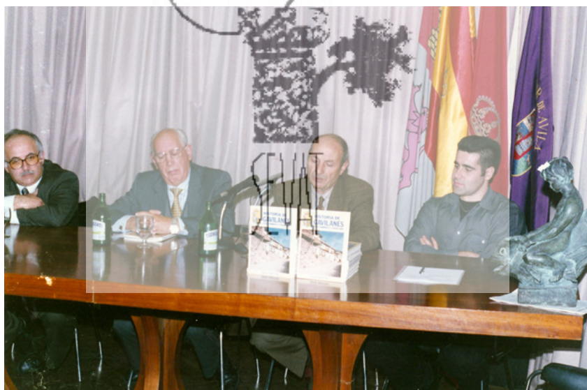
Presentación del libro "Historia de Gavilanes" en el Hogar de Ávila en Madrid.

Que viva Pedro Bernardo, que viva Mijares, que viva mi pueblo, GAVILANES”.