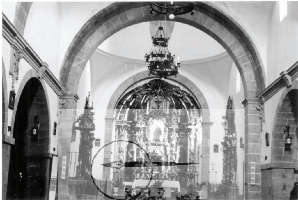
Iglesia parroquial de Pedro Bernardo. Interior

En las cuentas parroquiales de la segunda mitad del siglo XVII, figuran varias partidas de dinero empleado en obras que se hicieron en la iglesia, así entre los años 1646 y 1660, se trabajó en la capilla mayor cambiándose la cubierta, a base de materiales nuevos de madera, cantería, tejas, cal y clavazón. Hicieron la obra una cuadrilla de oficiales, siguiendo la traza que se había dado 1 . También se reformó la tribuna de la iglesia, haciéndose la carpintería nueva con elementos labrados y una reja nueva. Se mudó el púlpito para facilitar la obra y se hicieron asientos de piedra en la capilla mayor. Se ensanchó la iglesia, según figura en una partida de las cuentas de 1654, de 10.200 maravedís. " que pago a los maestros y oficiales de la obra de ensancho que se hizo en la iglesia "