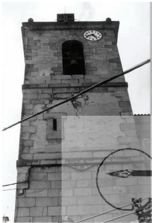
Iglesia parroquial de Pedro Bernardo. Torre.

el talud cinco pies y medio, arriba cinco pies. Debería llevar seis estribos, la torre que se edificaría junto al arco toral, hacia la parte del medio día, haría las veces de estribo, por lo que no se necesitarían más que cinco; los estribos tendrían dos pies y medio de salida por cuatro de frente hasta el talud y de allí arriba dos de salida y una vara de frente; por encima de la altura de las pechinas, podían echar otro talud en los estribos, aminorándolos medio pie hasta la cornisa; la cornisa debería ser de orden dórico; la capilla tendría dos ventanas de cinco pies de altura y vuelta de medio punto; en el interior llevaría una cornisa a nivel de las pechinas y un coronamiento de los cuatro arcos torales para formar la media naranja; quedaba a elección del cura y vecinos de la villa el hacer la cúpula de crucería