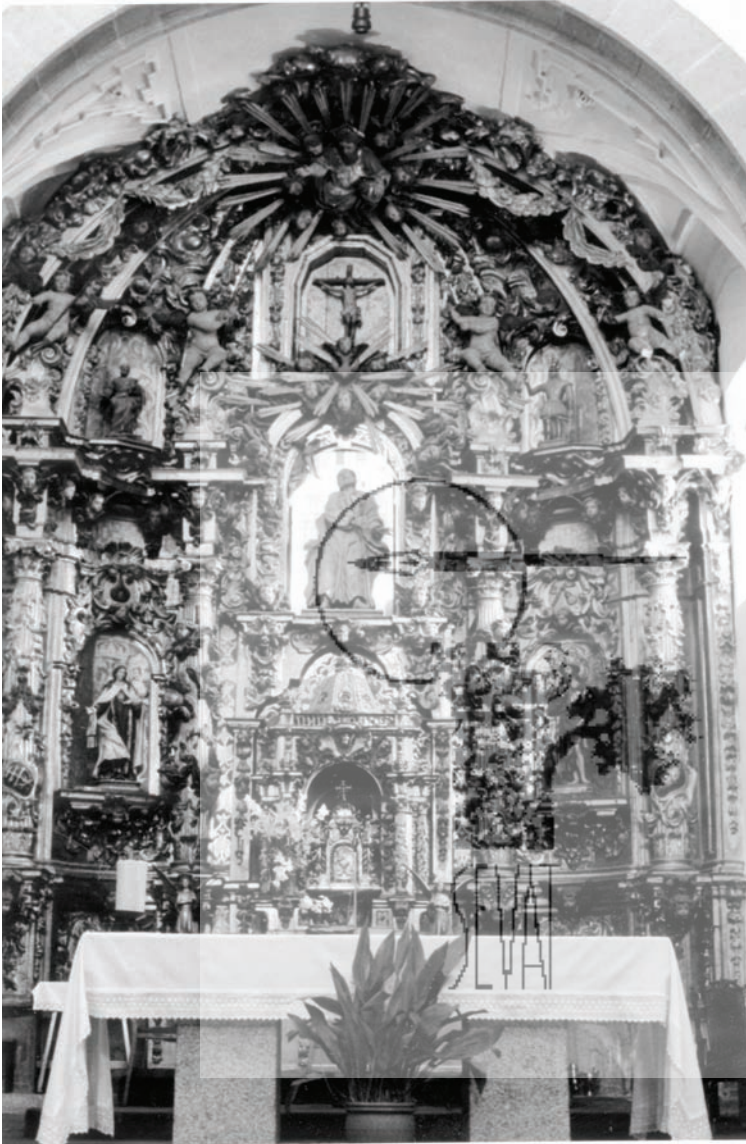
Iglesia parroquial de Pedro Bernardo. Retablo mayor.

dad de los muros se matiza por los ventanales abiertos en ellos, para aprovechar la mayor cantidad de luz que ofrece este lado del edificio. Tienen ventanas el presbiterio, la capilla mayor y cada tramo de la nave; están situadas en alto, por encima de las cubiertas de la sacristía, capilla del Cristo y puerta; también a esta fachada se abren dos ventanas de la torre, una de la escalera y la otra de una campana. Toda la fachada es-