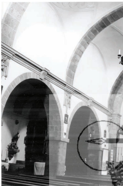
Iglesia parroquial de Pedro Bernardo. Nave central y lateral