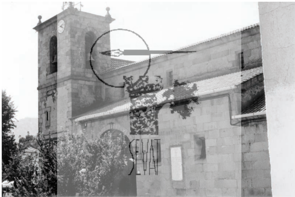
Iglesia parroquial de Pedro Bernardo. Lado sur

La iglesia se muestra en la parte alta del pueblo abrazada por el caserío, sobresaliendo en el paisaje urbano. Su edificación se hizo a mediados del siglo XVIII, aunque se conservan partes del edificio anterior del cual tenemos diferentes datos documentales.